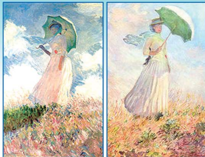
Donna con il parasole girata verso sinistra e Donna con il parasole girata verso destra - C. Monet, 1886, Musée d'Orsay, Parigi

Il Congresso è a numero chiuso e prevede un massimo di 100 Partecipanti, tra cui 40 Medici e 60 farmacisti. Per iscriversi: compilare ed inviare l'apposita scheda allegata entro il 04 Febbraio 2011. La Segreteria si riserva di riconfermare l'avvenuta iscrizione.